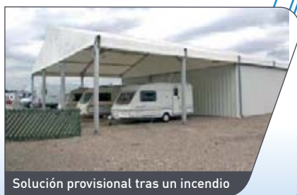
Solución provisional tras un incendio

Ambas cosas son posibles y se lograrán con la ayuda de Spaciotempo®. En una emergencia hemos sido capaces de dejar nuestros pabellones instalados y en condiciones de funcionamiento en 48 horas. Éste es un hecho a cuyo logro contribuye considerablemente el ligero (pero robusto) armazón de aluminio de sencilla estructura modular que puede ser fácilmente transportado e instalado con rapidez.