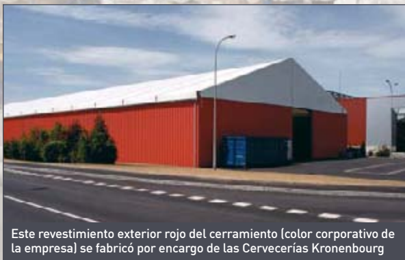
Este revestimiento exterior rojo del cerramiento (color corporativo de la empresa) se fabricó por encargo de las Cervecerías Kronenbourg