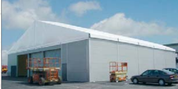
Estructura básica de almacenaje con cubierta térmica y revestimiento exterior en panel sándwich para un mejor aislamiento