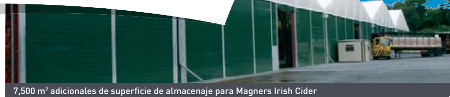
7,500 m 2 adicionales de superficie de almacenaje para Magners Irish Cider

Nuestros pabellones pueden ser alquilados por periodos de 1 mes hasta 20 años, y pueden ser fácilmente adaptados a las cambiantes necesidades de su empresa mediante las pertinentes modificaciones, ampliaciones, reducciones y reubicaciones. Después de todo, una empresa flexible es una empresa saneada.