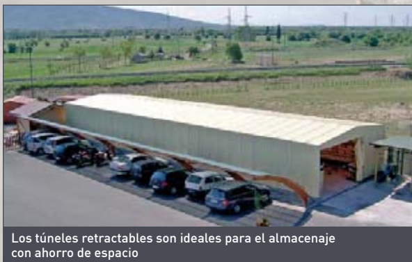
Los túneles retractables son ideales para el almacenaje con ahorro de espacio