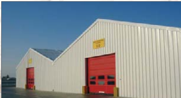
Adosando estos pabellones se obtienen 1.600 m 2 de espacio adicional de almacenaje industrial en Prysmian, España