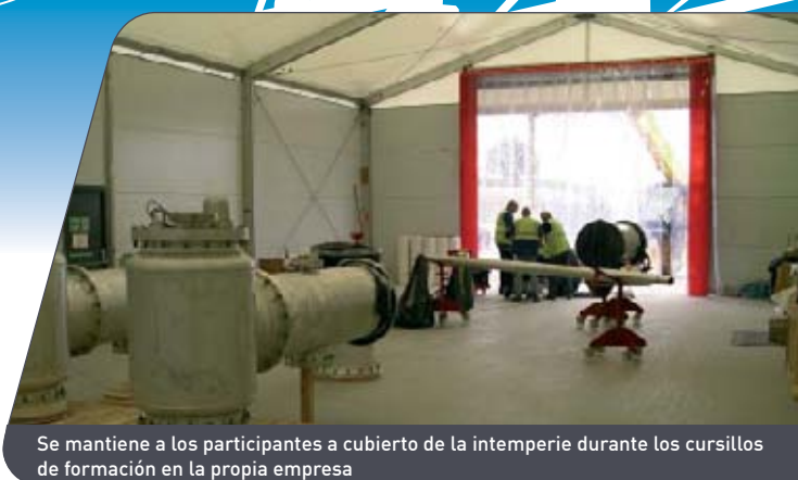
Se mantiene a los participantes a cubierto de la intemperie durante los cursillos de formación en la propia empresa