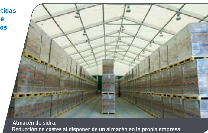
Almacén de sidra. Reducción de costes al disponer de un almacén en la propia empresa

Con Spaciotempo® podrá rápidamente aumentar su superficie de almacenaje. Desde el almacén básico hasta un espacio con temperatura controlada; disponemos de un extenso stock de material para dar respuesta inmediata a su demanda. Nos adaptamos a sus necesidades mediante opciones de cerramientos perimetrales y distintos tipos de cubiertas. Adosando nuestros pabellones puede disponer de una selección ilimitada de pórticos y longitudes, que le permitirá crear y modular el espacio hasta el infinito (de 5 a 40 metros de anchura, longitud ilimitada en múltiplos de 5 m, altura lateral en punto mínimo hasta 8 m).