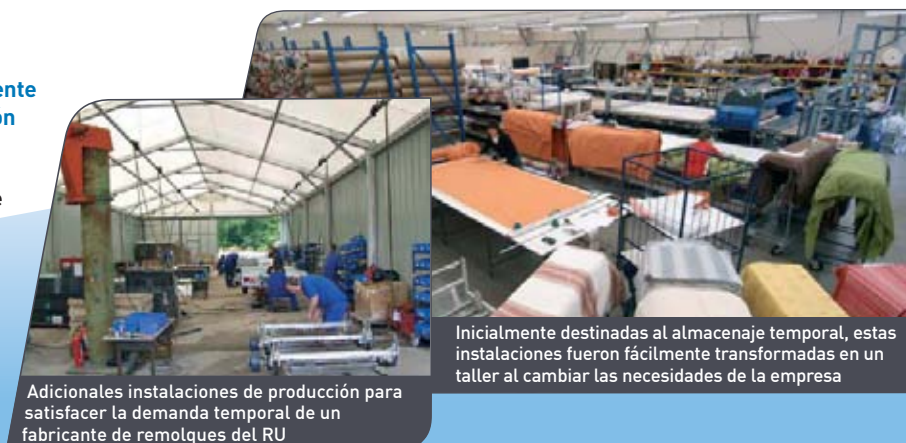
Adicionales instalaciones de producción para satisfacer la demanda temporal de un fabricante de remolques del RU

El diseño modular básico de Spaciotempo® puede adaptarse fácilmente para crear unas óptimas instalaciones de producción. El trabajo de producción puede desarrollarse en condiciones de alta luminosidad natural proporcionada por la cubierta de PVC blanco semitranslúcido, o artificial, a través de una gama de opciones de iluminación, climatización, calefacción... Puede además implementarse la clásica línea de producción estableciendo rutas opuestas de entrada y salida.