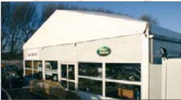
Las dobles puertas y ventanas acristaladas realzan esta sala de exposición de automóviles