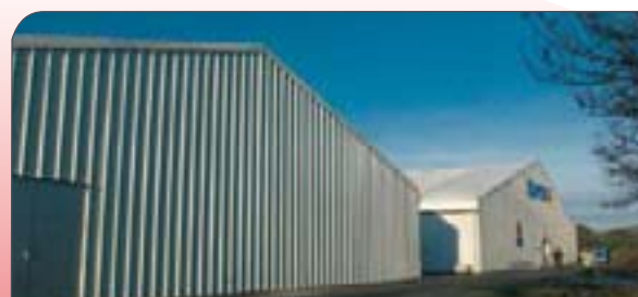
En Super U en Francia se instalaron rápidamente un almacén y un supermercado temporales después de un incendio

Ello es posible y será una realidad con la ayuda de Spaciotempo®. En sólo unos días dispondrá Vd. de un espacio verdaderamente operativo que le garantiza en todo momento una perfecta explotación.