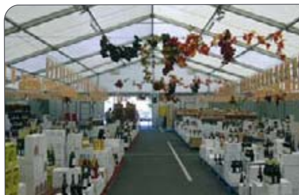
Leclerc logró en Francia incrementar al máximo sus ganancias con un espacio adicional de venta durante la feria anual del vino