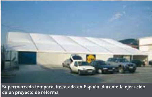
Supermercado temporal instalado en España durante la ejecución de un proyecto de reforma