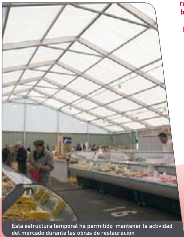
Esta estructura temporal ha permitido mantener la actividad del mercado durante las obras de restauración

Spaciotempo® dispone del mayor parque de estructuras y equipamientos de alquiler de Europa. Según el pliego de condiciones, tendrá Vd. en cuestión de días a su disposición sus locales temporales de venta al por menor. Tanto si necesita Vd. una simple estructura como si sus necesidades son las de contar con un espacio totalmente acabado, parquet, control de temperatura, iluminación, puertas y ventanas o decoración interior, Spaciotempo® puede ofrecer soluciones completas específicamente adaptadas a su sector.