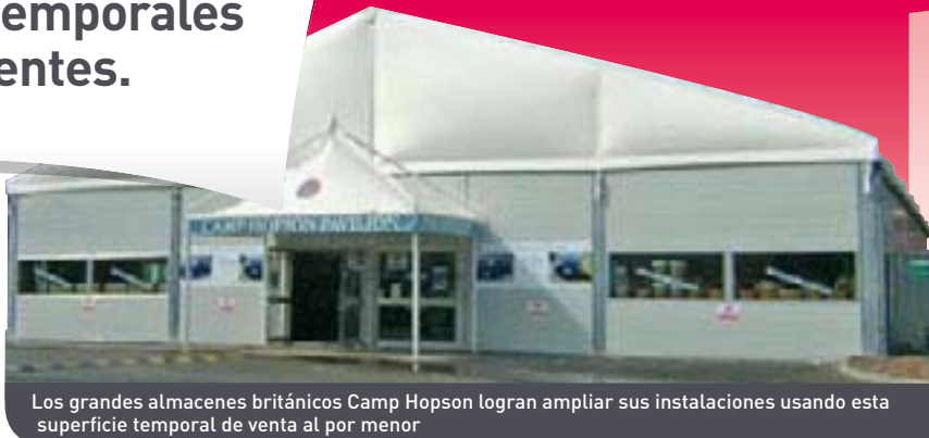
Los grandes almacenes británicos Camp Hopson logran ampliar sus instalaciones usando esta superficie temporal de venta al por menor

Nuestras estructuras pueden tenerse alquiladas por espacio de períodos de tiempo desde 1 mes hasta 20 años, y pueden ser fácilmente adaptadas al crecimiento y a la evolución de su negocio mediante las pertinentes modificaciones, ampliaciones y reubicaciones. Después de todo, una empresa flexible es una empresa que sabe adaptarse a las evoluciones de su mercado.