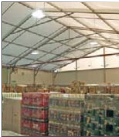
Estas instalaciones de almacenamiento adicionales permiten a este grupo internacional gestionar un pico de demanda estacional

Desde el almacén estándar sin aislamiento hasta el almacén para mercancías «delicadas» que requieren un control de la temperatura, disponemos de una extensa gama soluciones en revestimientos y cubiertas que se adaptan a todas sus necesidades.