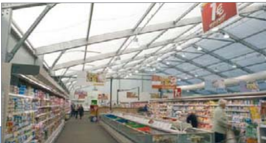
Un supermercado temporal permitió a Super U en Francia seguir operando después de un incendio

Spaciotempo® creará una sala de exposición perfectamente adaptada a sus necesidades proponiéndole una extensa gama de equipamientos y accesorios.