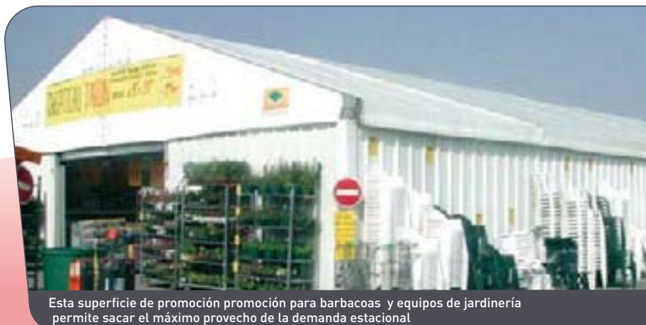
Esta superficie de promoción para barbacoas y equipos de jardinería permite sacar el máximo provecho de la demanda estacional