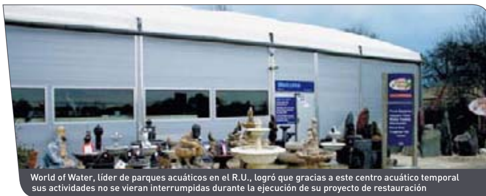
World of Water, líder de parques acuáticos en el R.U., logró que gracias a este centro acuático temporal sus actividades no se vieran interrumpidas durante la ejecución de su proyecto de restauración

Desde supermercados hasta salas de exposición, las estructuras Spaciotempo® son la solución ideal a sus necesidades de superficies temporales. Nuestra gran variedad de opciones y equipamientos le permitirán personalizar su nueva superficie. (Anchuras de 5 a 40 m, longitudes ilimitadas en múltiplos de 5 m, alturas laterales de 3 a 7 m).