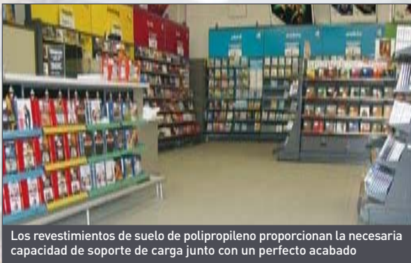
Los revestimientos de suelo de polipropileno proporcionan la necesaria capacidad de soporte de carga junto con un perfecto acabado